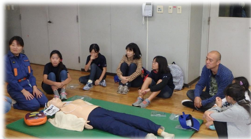
救命の連鎖 ～急変から社会復帰までの一連の行い～