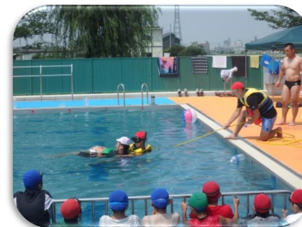
救助隊が溺れている人を救出中！！

両日ともに、気温35℃を超える猛暑日の中、水分や塩分を補給しながら暑さに打ち勝ち、結果として一人も熱中症になることはありませんでした。活動を通して災害発生時にどんな過酷な状況下でも生き抜く強靱な精神力が身につきました。