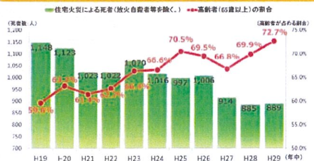
住宅火災による死者数と高齢者の割合

すべての住宅に設置が必要な住宅用火災警報器。電池切れで万が一の時に作動しなかったということがないよう、定期的に作動確認することが大切です。